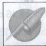
Missile niveau 2